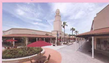
Ami Premium Outlets