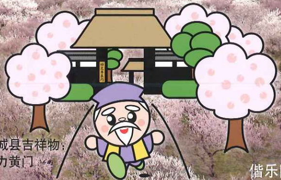
茨城县吉祥物：活力黄门